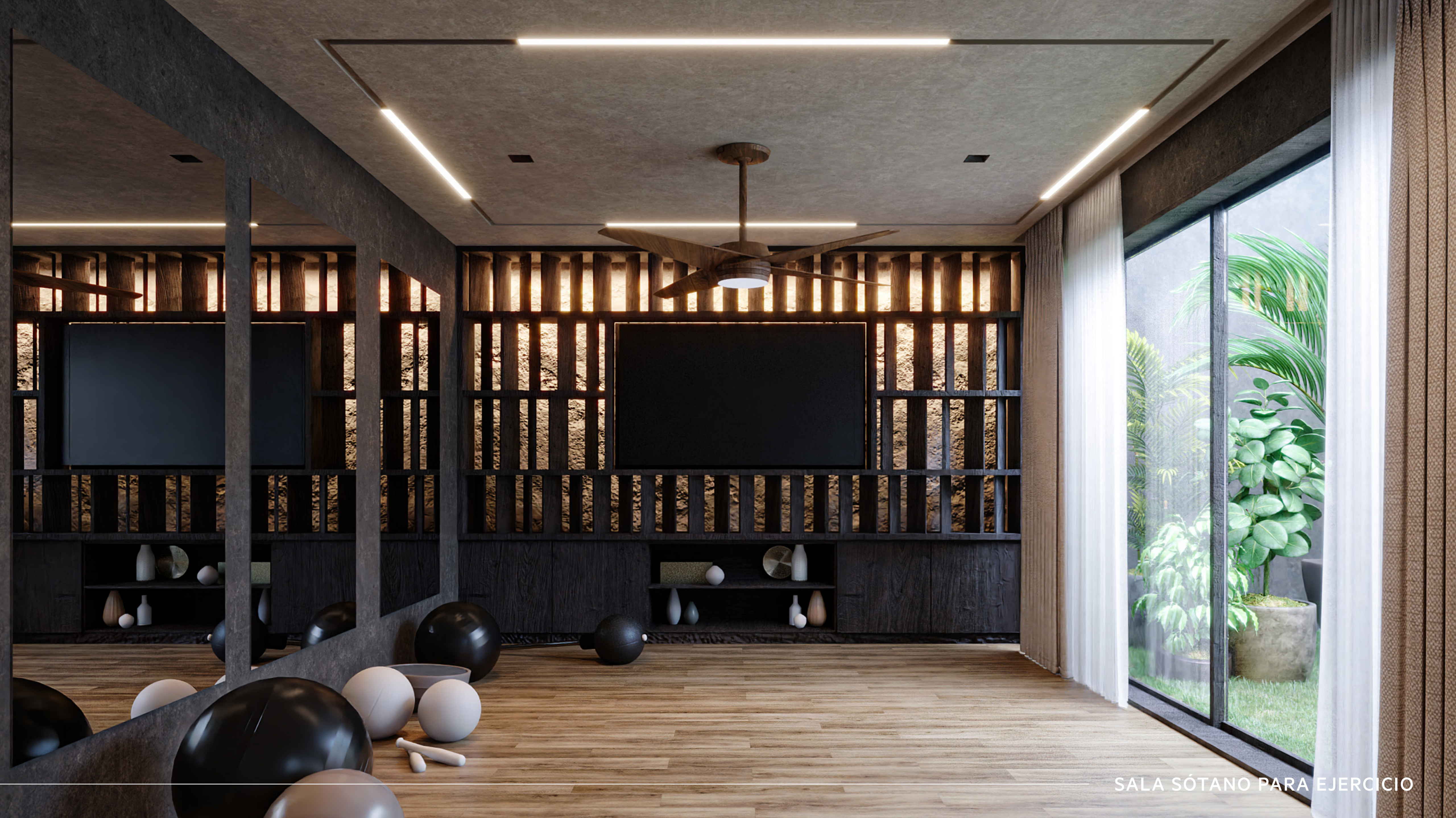
SALA SÓTANO PARA EJERCICIO