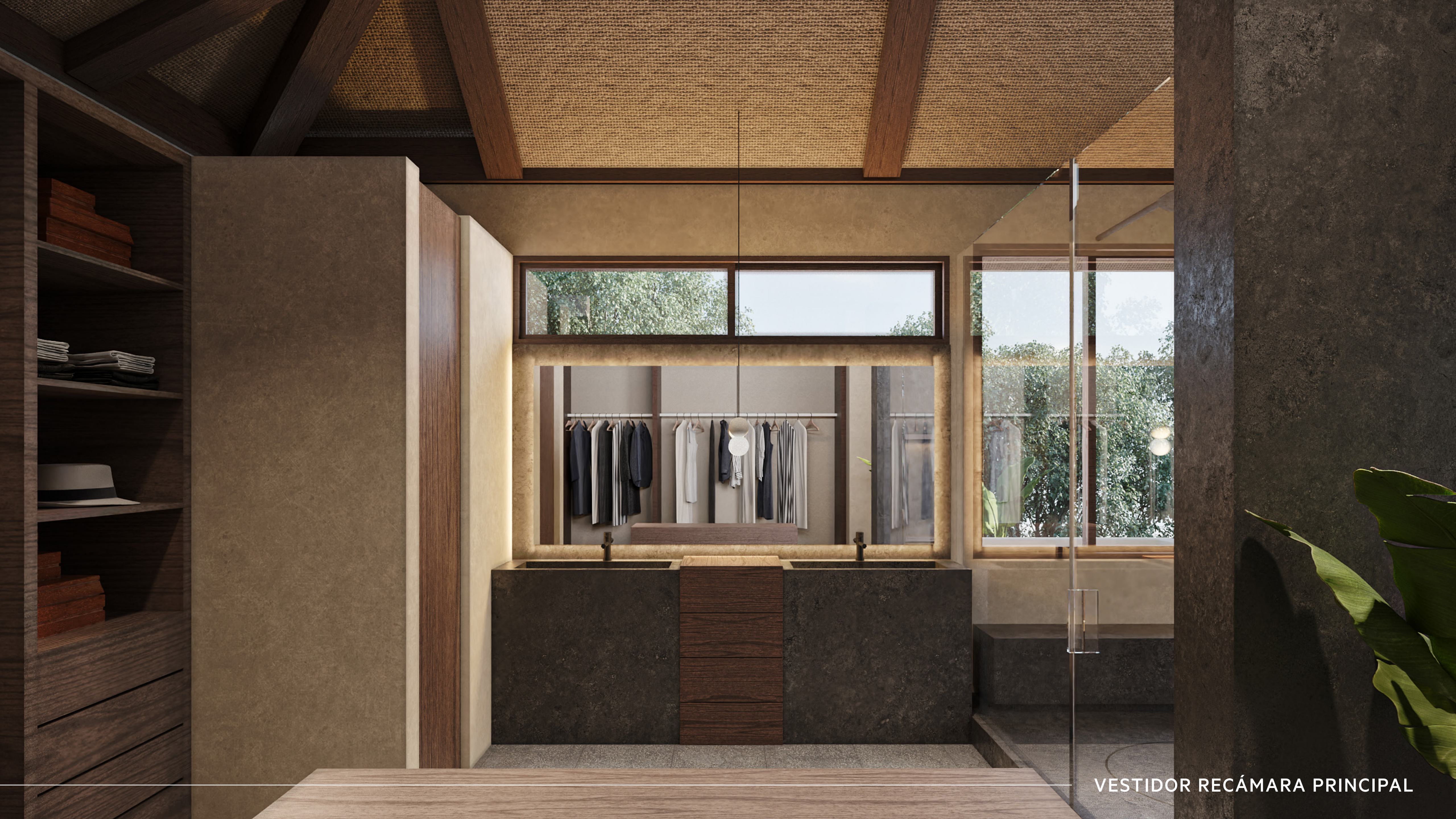
VESTIDOR RECÁMARA PRINCIPAL